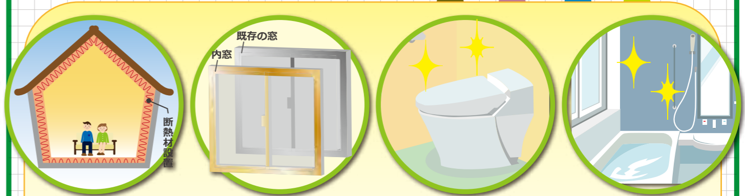
ア・断熱改修（内・外壁等） イ・断熱改修（窓） ウ・節水トイレへの改修 エ・高断熱浴槽への改修