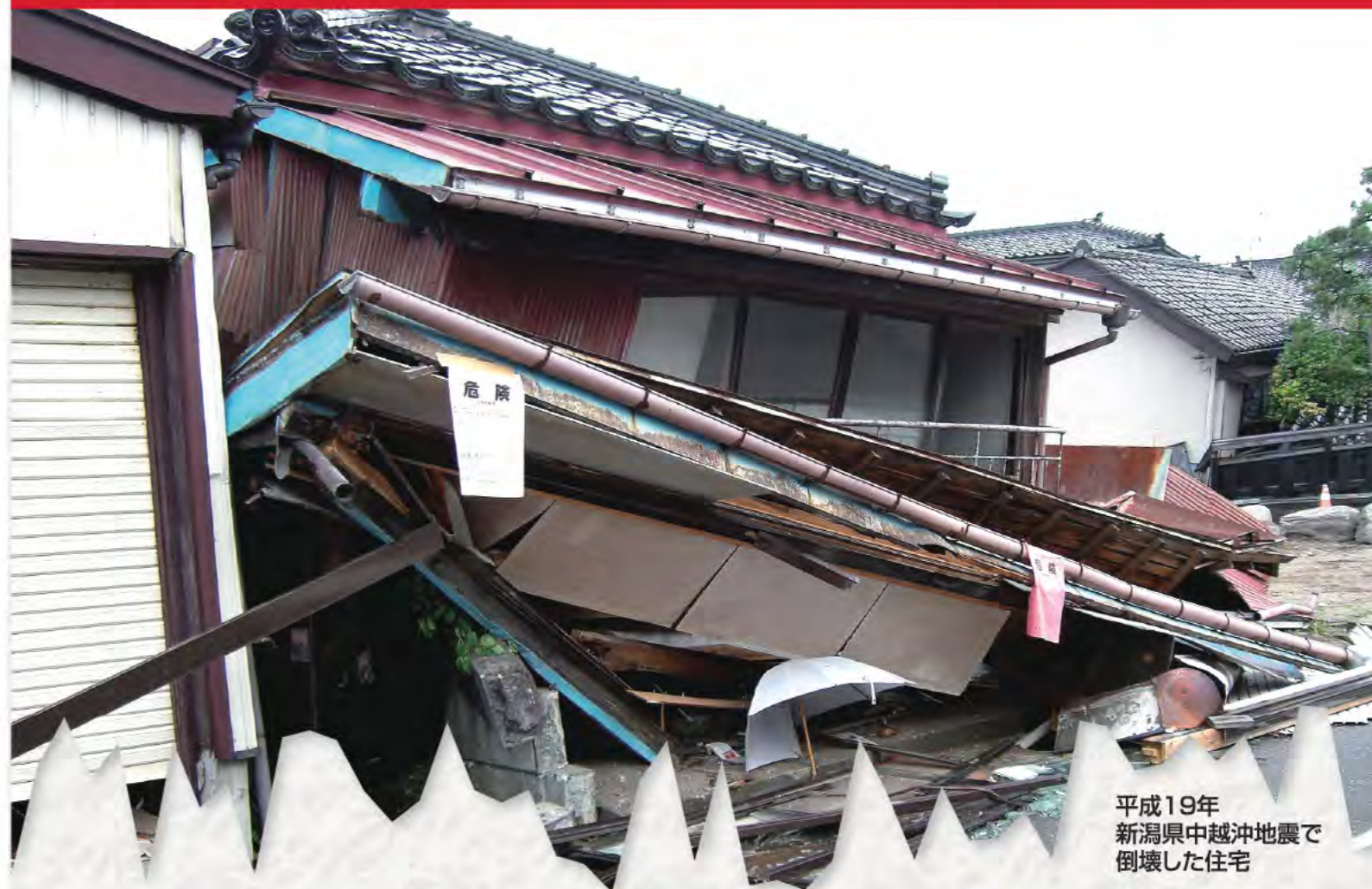
平成19年 新潟県中越沖地震で 倒壊した住宅